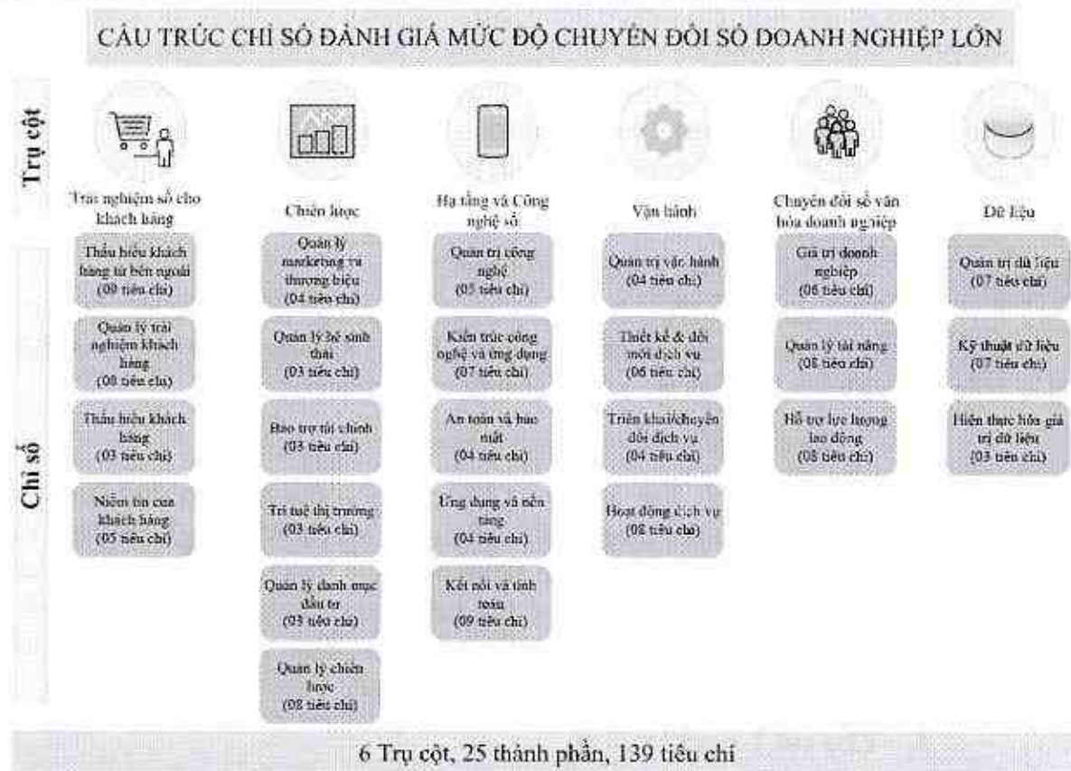
Hình 2. Cấu trúc Chỉ số đánh giá mức độ chuyển đổi số doanh nghiệp lớn

Chỉ số đánh giá mức độ chuyển đổi số doanh nghiệp lớn được cấu trúc theo 06 trụ cột (pillar) gồm: (1) Trải nghiệm số cho khách hàng, (2) Chiến lược, (3) Hạ tầng và công nghệ số, (4) Vận hành, (5) Chuyển đổi số văn hóa doanh nghiệp, và (6) Dữ liệu và tài sản thông tin. Trong mỗi trụ cột có các chỉ số thành phần, trong mỗi chỉ số thành phần có các tiêu chí (25 chỉ số thành phần và 139 tiêu chí). Sơ đồ cấu trúc Chỉ số đánh giá mức độ chuyển đổi số doanh nghiệp lớn được mô tả như Hình 2.