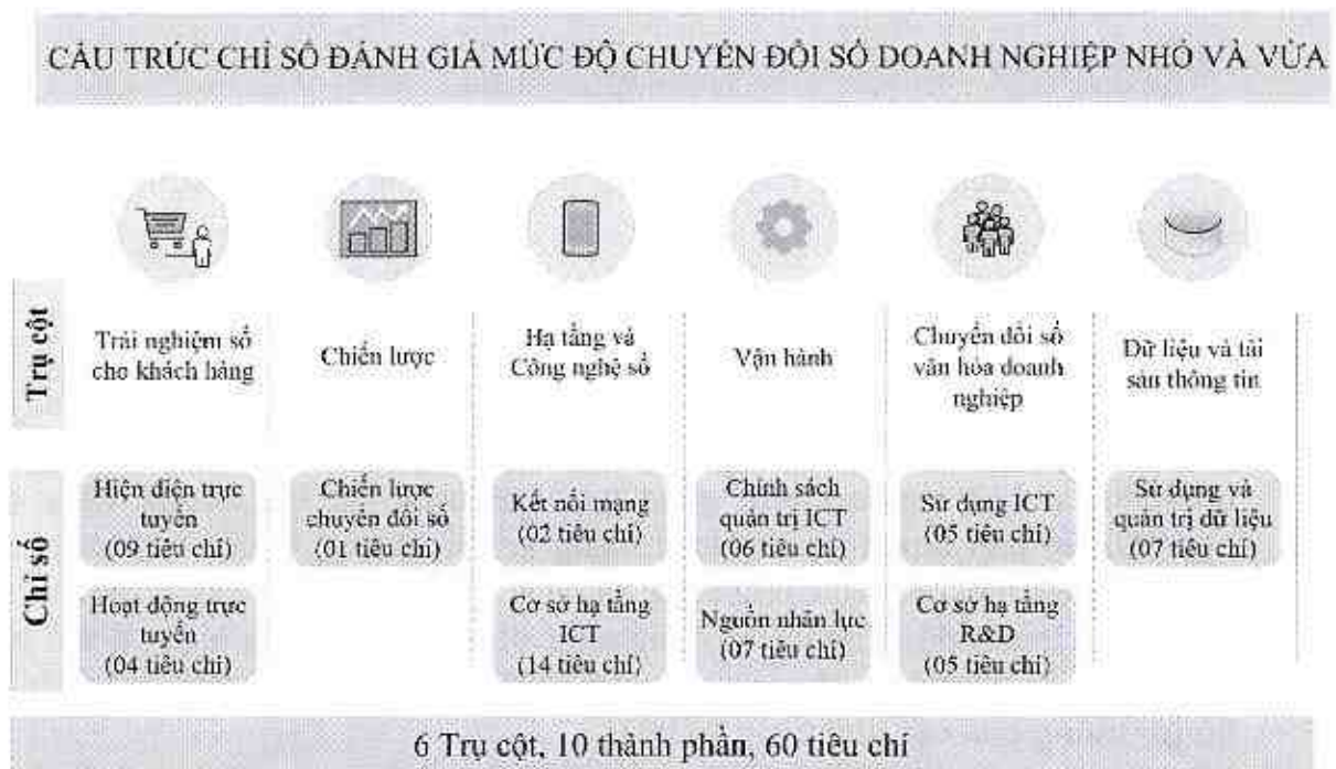
Hình 1. Cấu trúc Chỉ số đánh giá mức độ chuyển đổi số doanh nghiệp nhỏ và vừa

Trong mỗi trụ cột có các chỉ số thành phần, trong mỗi chỉ số thành phần có các tiêu chí (10 chỉ số thành phần và 60 tiêu chí). Sơ đồ cấu trúc Chỉ số đánh giá mức độ chuyển đổi số doanh nghiệp nhỏ và vừa được mô tả như Hình 1.